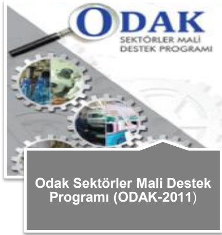
Odak Sektörler Mali Destek Programı (ODAK-2011)