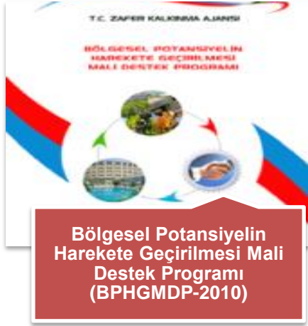
Bölgesel Potansiyelin Harekete Geçirilmesi Mali Destek Programı (BPHGM DP-2010)