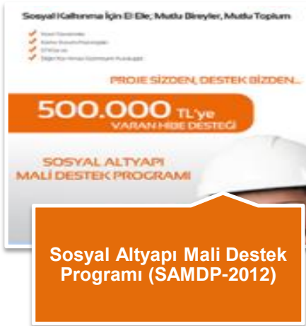
Sosyal Altyapı Mali Destek Programı (SAMDP-2012)