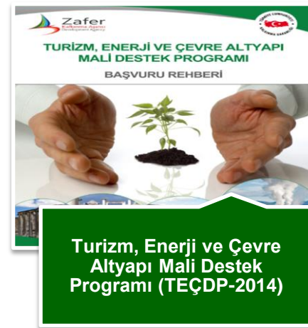
Turizm, Enerji ve Çevre Altyapı Mali Destek Programı (TEÇDP-2014)