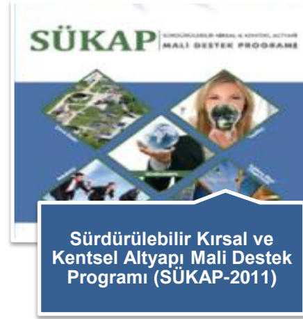
Sürdürülebilir Kırsal ve Kentsel Altyapı Mali Destek Programı (SÜKAP-2011)