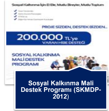
Sosyal Kalkınma Mali Destek Programı (SKMDP-2012)