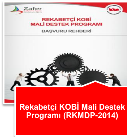
Rekabetçi KOBİ Mali Destek Programı (RKMDP-2014)