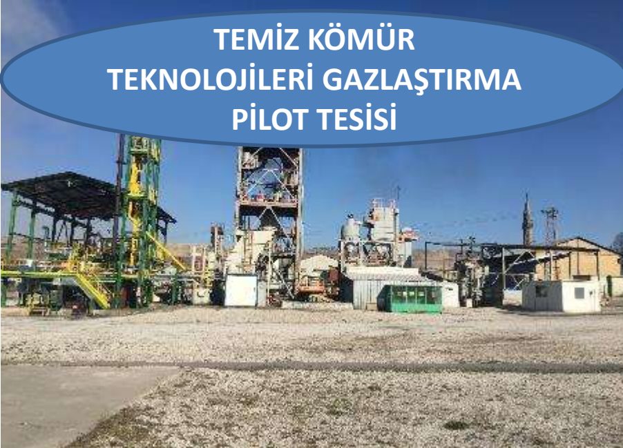
TEMİZ KÖMÜR TEKNOLOJİLERİ GAZLAŞTIRMA PİLOT TESİSİ