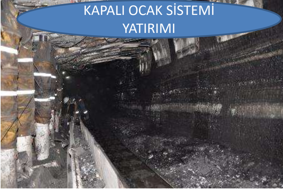
KAPALI OCAK SİSTEMİ YATIRIMI