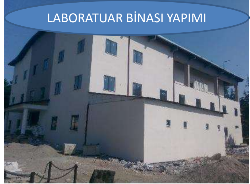
LABORATUAR BİNASI YAPIMI